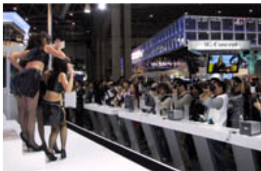
Utseendet främst – här sett bakifrån