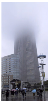
Mässlokal i dimma...

Åkte till Yokohama, där världens ösregn befann sig. Gick på flygmässan Japan Air Show, en tillställning som bara hålls vart fjärde år. Också den här gången gick det fint att komma in som representant för pressen - Underlag News - känns det bekant? Med ett utländskt visitkort och lite framåtanda kan man komma långt. På tillbakavägen från Yokohama höll vi nästan på att blåsa bort - tyfonen som svepte förbi innehöll otroliga regnmängder och höga vindhastigheter. På kvällen kom lugnet efter stormen, men när vi skulle vi shoppa elektronikprylar i stadsdelen Akihabara så visade det sig att affärerna redan hade stängt på grund av vädret. En leksaksaffär och några mataffärer hade dock öppet, så inköpen begränsade sig till en radiostyrd helikopter och lite kakor.