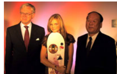
På releaseparty: Sveriges ambassadör, ANA samt hennes japanska manager.