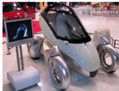
På bilutställning. Måhända framtidens bil?