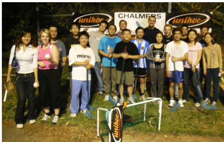
Unihoc-spelare är vi allibopa. Uppslutningen var stor vid Taiwans nypremiär.

Förväntansfulla och nyfikna studenter fick tidigare ikväll vara med om en världs(ny)premiär, då unihoc (=innebandy) introducerades i Taiwan, på NCTU i Hsinchu.