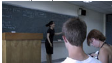
Vår lärare går här igenom verbens placering

Språkkurs som vanligt. Fick idag reda på att jag inte kommer få mitt studentkort på ett tag, eftersom mina egentliga studier inte börjar förrän den 13 september. Well, det ska nog lösa sig ändå.